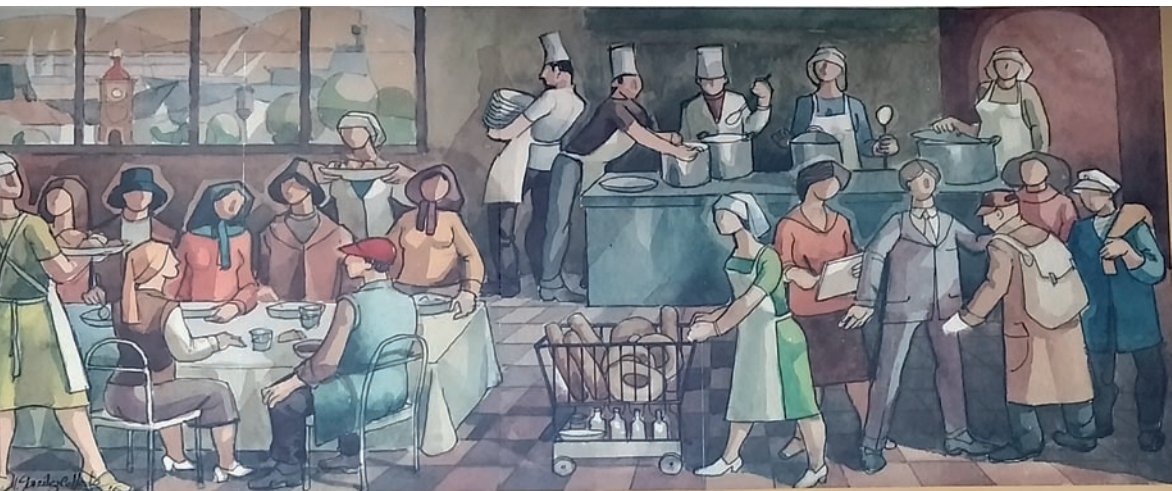
Mural. José González Collado