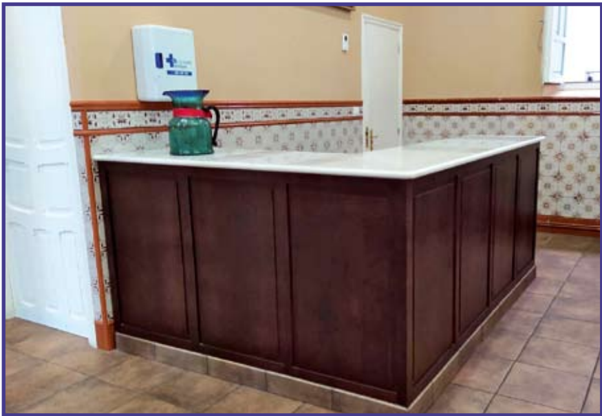
Reposición de carpintería: Mostrador