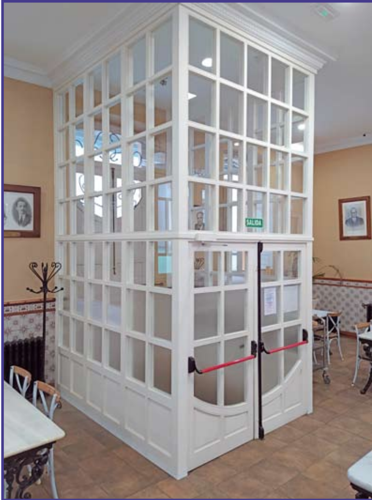
Reposición de carpintería: Corta aires