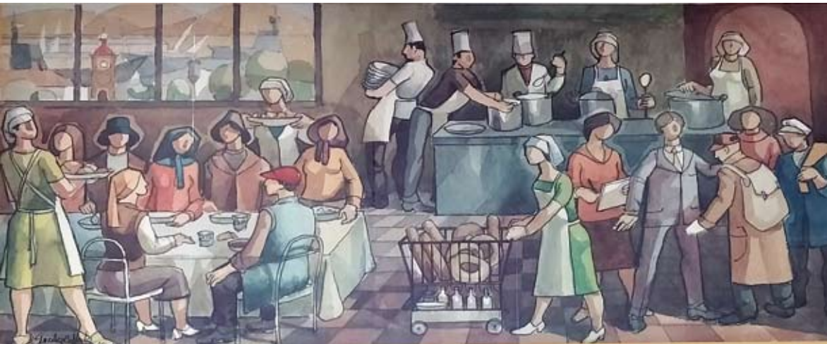
Mural. José González Collado