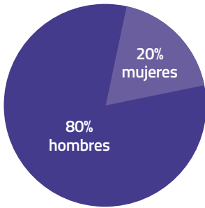
GRÁFICO 2: DATOS PERSONAS USUARIAS SERVICIO COMEDOR 2018.