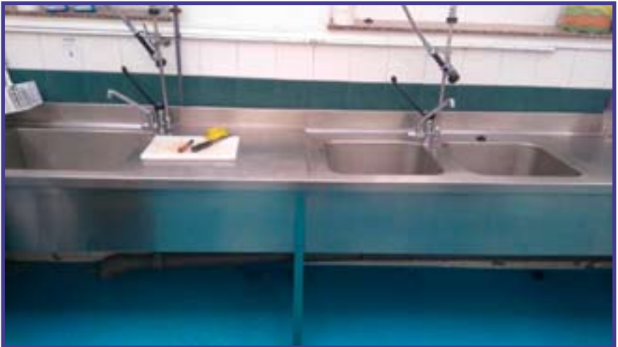
Adaptación zona lavado cocina (reforma, electricidad y mobiliario).